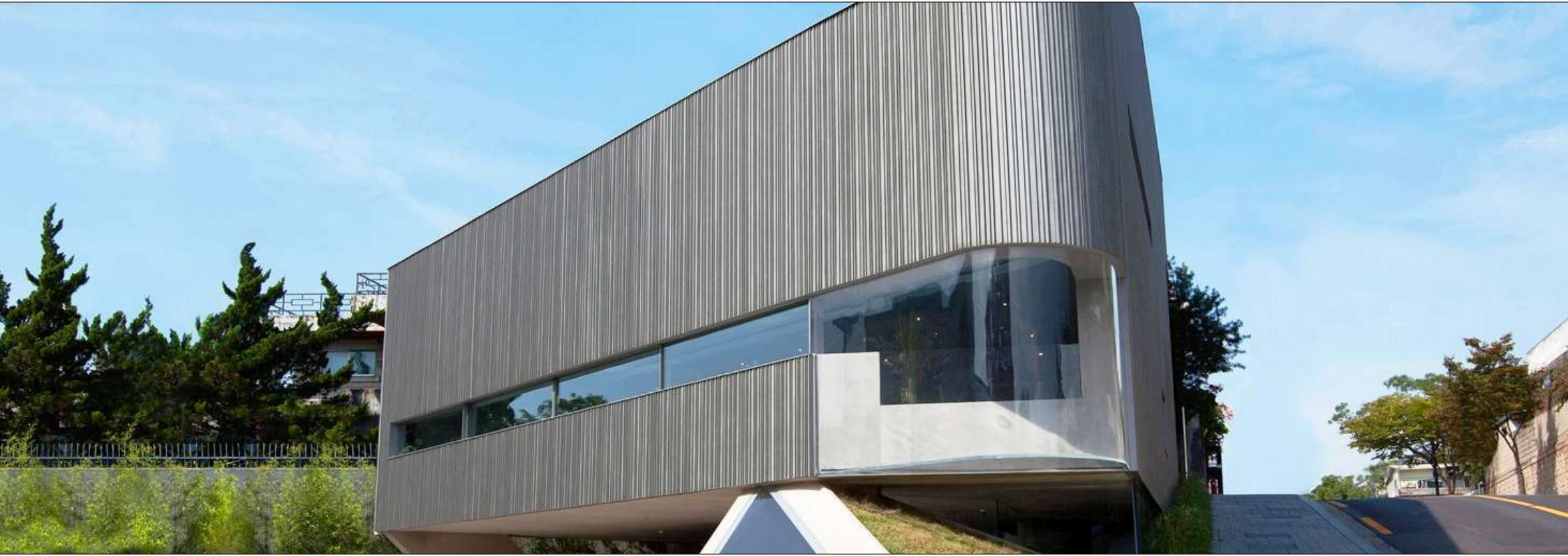
종로구 화동 송원아트센터